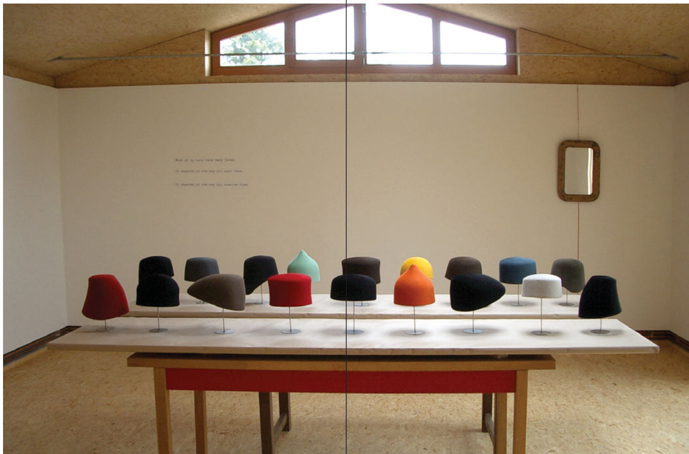
Two Tables with Hats , Feldafing 2005