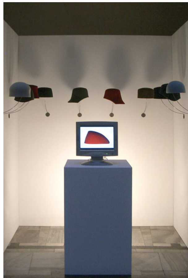
Wieczór Karnawałowy Fundacji Zbiorów Sztuki Współczesnej Muzeum Narodowego, Warszawa 2006