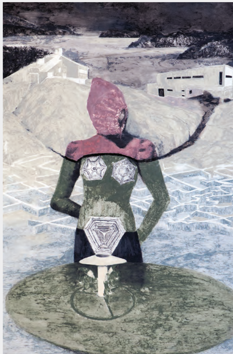
Bez tytułu , 2017, z cyklu bez ruch ; olejny pastel na papierze, 150 x 110 cm

Galeria Muzalewska, Poznań kwiecień – maj 2018 Copyrights © by Galeria Muzalewska and Authors Układ graficzny: Jacek Grześkowiak Druk: Drukarnia Empir