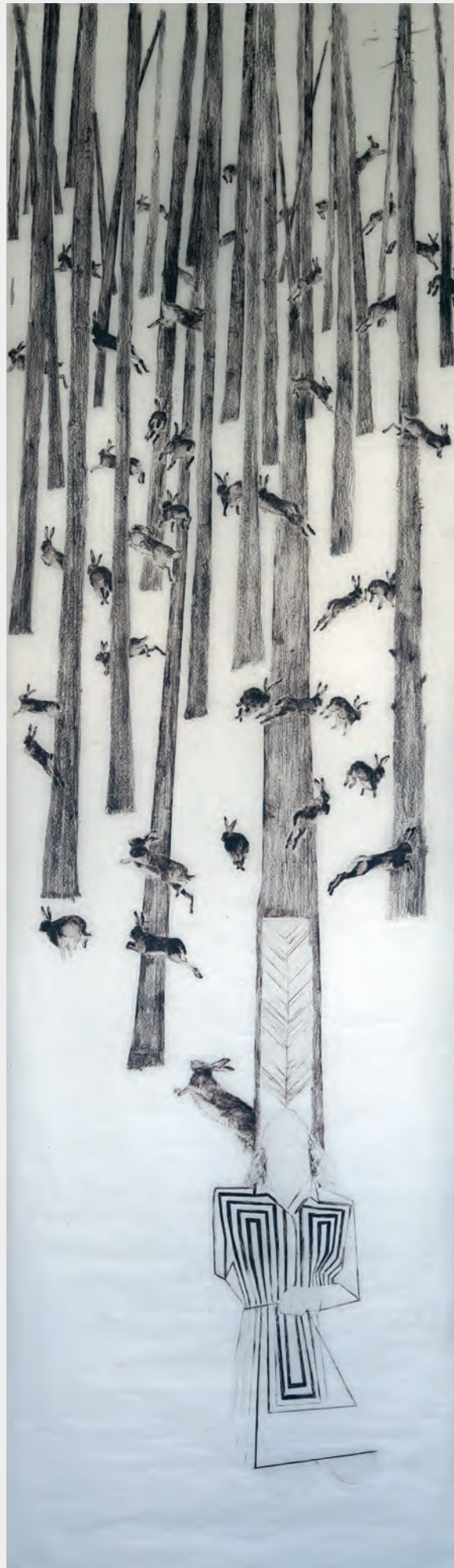
Bez tytułu, 2018, z cyklu bez ruch ; olejny pastel na bibułce, 331 × 100 cm