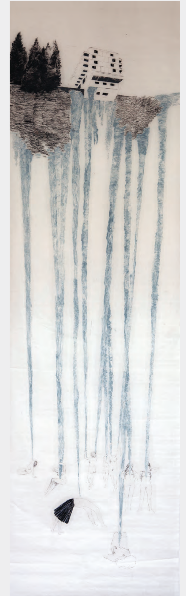
Bez tytułu, 2018, z cyklu bez ruch ; olejny pastel na bibułce, 337 × 100 cm