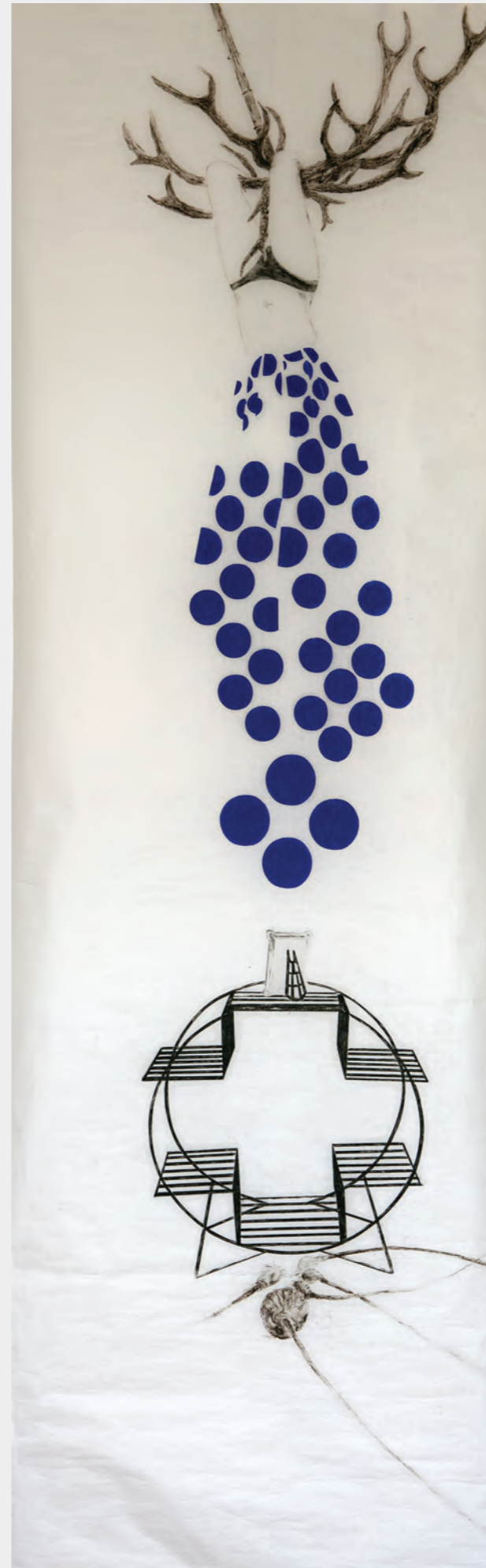
Bez tytułu, 2018, z cyklu bez ruch ; olejny pastel na bibułce, 319 × 100 cm

Artystka rozpatruje tu przemienność bezruchu i ruchu, stąd taki tytuł. W samym jego zapisie w syntetyczny sposób zawarta jest owa cykliczność pracy, jak i szerzej – cykliczność życia kobiety-artystki. W poetycki sposób – z ożywieniem na nowo niektórych znanych z innych cykli Moniki Szwed motywów – ta cykliczność: wyczekiwanie i spełnienie, brak oraz zaspokojenie, to, co niegdyś i to, co na zawsze – obrazowane są tu w fascynujący sposób. Artystka w całej swej pracy obmyśla i unaocznia owo Niegdyś oraz Zawsze. Poszukuje jednego albo drugiego. Uzmystawia tęsknotę za owym mitycznym Niegdyś i wymarzonym Zawsze. 4