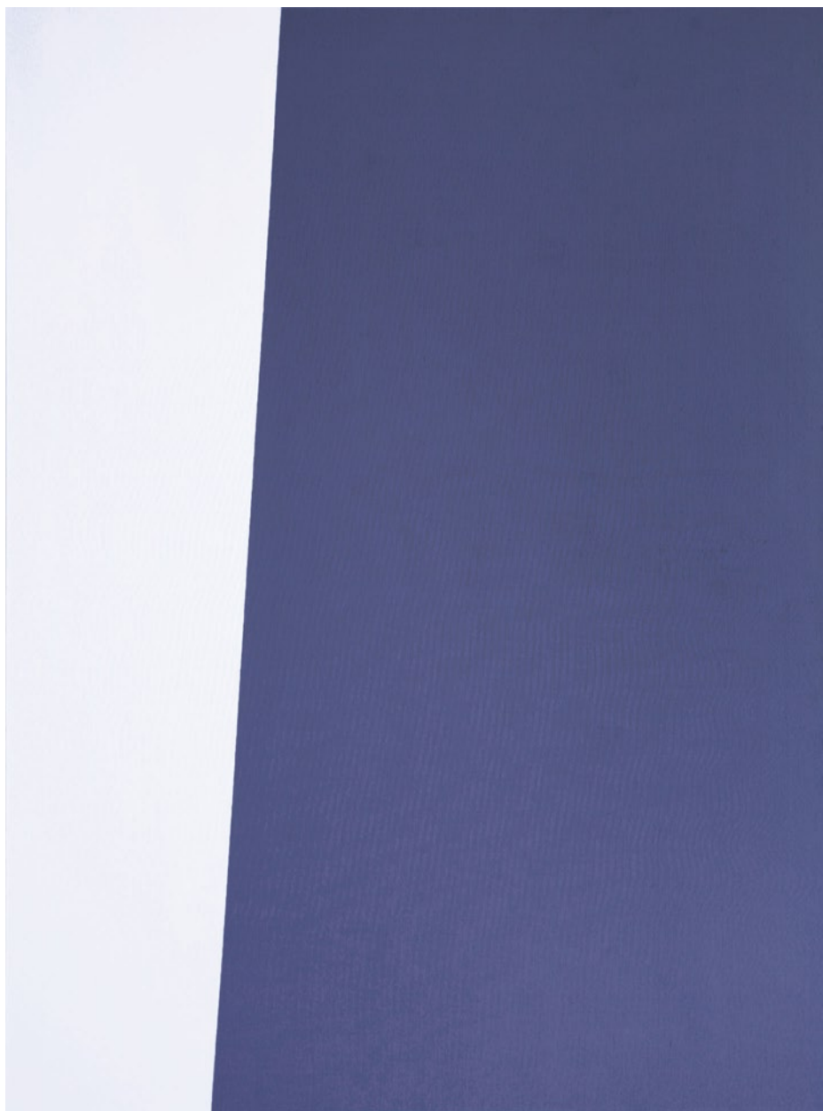
Przebiegi XII , 2011, akryl na płótnie, 160 × 120 cm