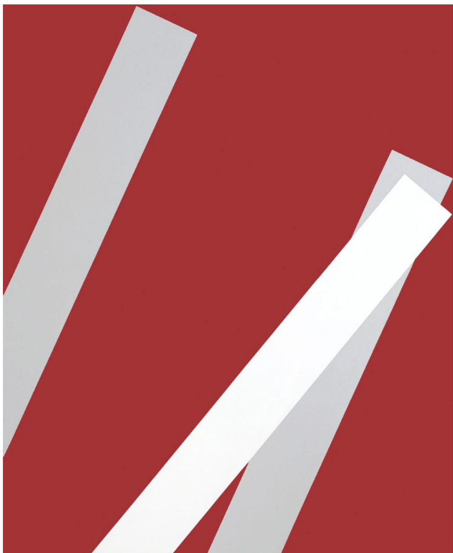
Przebiegi II , 2010, akryl na płótnie, 150 × 105 cm