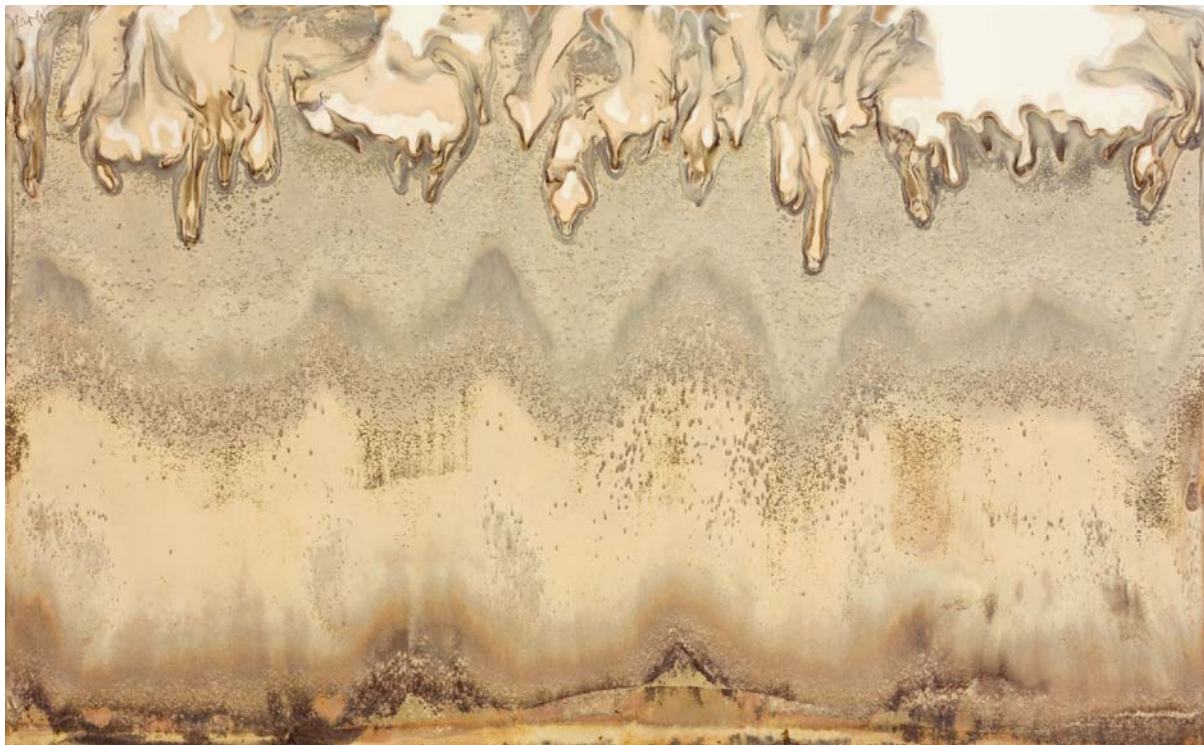
katalog pozycja 15 / Catalogue number 15