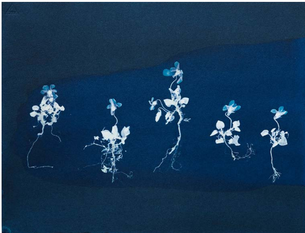
katalog pozycja 7 / Catalogue number 7