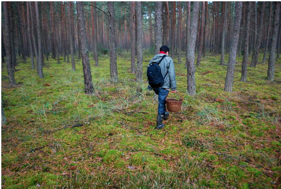
katalog pozycja 1 / Catalogue number 1