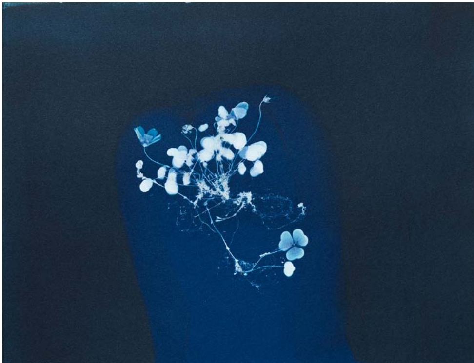
katalog pozycja 5 / Catalogue number 5